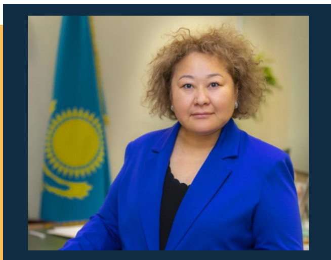
Жанель Кушукова, вице-министр торговли и интеграции Республики Казахстан

ОЭСР поддержала реформы в таких областях, как развитие частного сектора, интернационализация, цифровизация, торговое и транспортное сообщение и устойчивость к внешним воздействиям. ОЭСР опиралась на свои основные преимущества: политический диалог на высоком уровне для укрепления экономического сотрудничества ЕС-ОЭСР-Центральная Азия, обмена передовым опытом и стремления к дальнейшему проведению реформ; семинары на уровне стран для развития диалога между государственным и частным секторами, сбора данных и наращивания потенциала; а также основанные на фактах публикации, содержащие оценки и рекомендации по вопросам политики, результаты опросов частного сектора и примеры передового опыта в страна