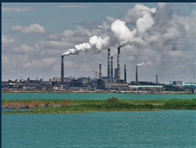
La centrale elettrica a carbone di Balkhash è la più antica del Kazakistan, essendo entrata in funzione nel 1937.

Una bozza di risoluzione elaborata dall'Assemblea parlamentare del Consiglio d'Europa (APCE) critica aspramente il governo georgiano per il "persistente deterioramento della democrazia in Georgia e per la mancanza di risposte alle raccomandazioni dell'Assemblea volte a porvi rimedio". La risoluzione aggiunge che la prosecuzione dell'attuale linea politica da parte del governo di Sogno Georgiano "di fatto instaurerebbe una dittatura a partito unico in Georgia, violando i principi democratici fondamentali e risultando incompatibile con l'adesione al Consiglio d'Europa". Nelle condizioni attuali, si legge nella bozza di risoluzione, non è possibile tenere elezioni libere ed eque nel Paese. Pur deplorando la condotta del governo, la bozza indica che l'APCE "resta impegnata in un dialogo aperto e orientato ai risultati con le autorità [georgiane], nonché con tutte le altre forze politiche e sociali del Paese".